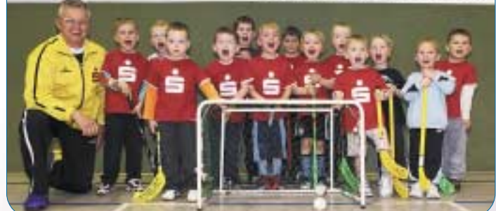
Bereits die Knirpse U4 / U5 sind begeisterte Floorballspieler