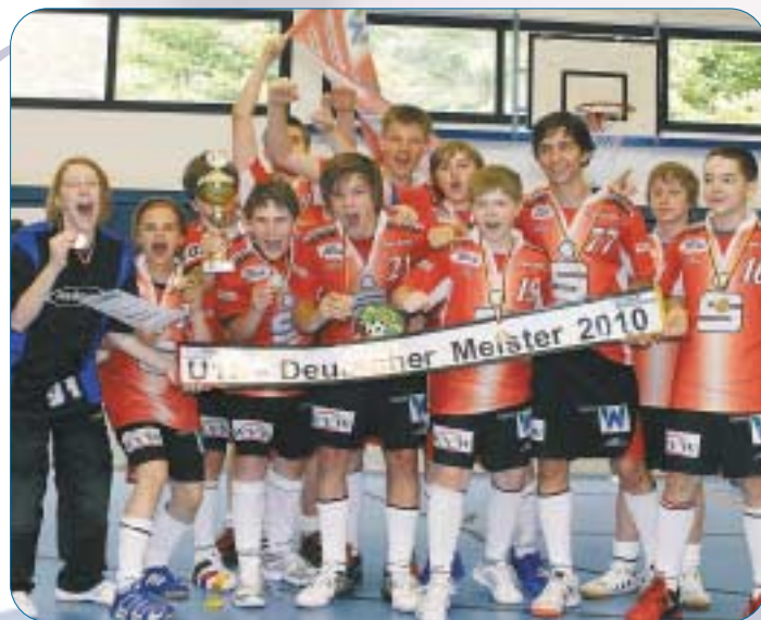
Deutscher Meister U15 2010

In Deutschland ist der UHC Sparkasse Weißenfels e.V. mit ca. 300 Mitgliedern der größte und mit 16 deutschen Meistertiteln der erfolgreichste Floorball-Club in Deutschland.