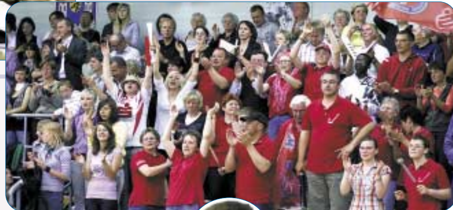
Eine immer größer werdende Fangemeinde unterstützt die Spitzenteams

Floorball ist nicht nur eine der rasantesten Mannschaftssportarten der Welt, sondern auch eine der am schnellsten wachsenden. Gespielt wird mit einem Lochball auf einem Spielfeld, das 40x20 Meter misst und von einer kniehohen Bande umgeben ist. Pro Team treffen fünf Feldspieler und ein Torhüter aufeinander. Während die Feldspieler mit Kunststoffschlägern ausgerüstet sind, agiert der Goalie ohne Schläger, ist aber mit Schutzbekleidung ausgestattet.