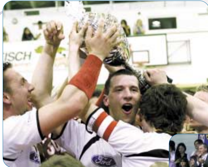
Deutscher Meister 2010

Floorball ist nicht nur eine der rasantesten Mannschaftssportarten der Welt, sondern auch eine der am schnellsten wachsenden. Gespielt wird mit einem Lochball auf einem Spielfeld, das 40x20 Meter misst und von einer kniehohen Bande umgeben ist. Pro Team treffen fünf Feldspieler und ein Torhüter aufeinander. Während die Feldspieler mit Kunststoffschlägern ausgerüstet sind, agiert der Goalie ohne Schläger, ist aber mit Schutzbekleidung ausgestattet.