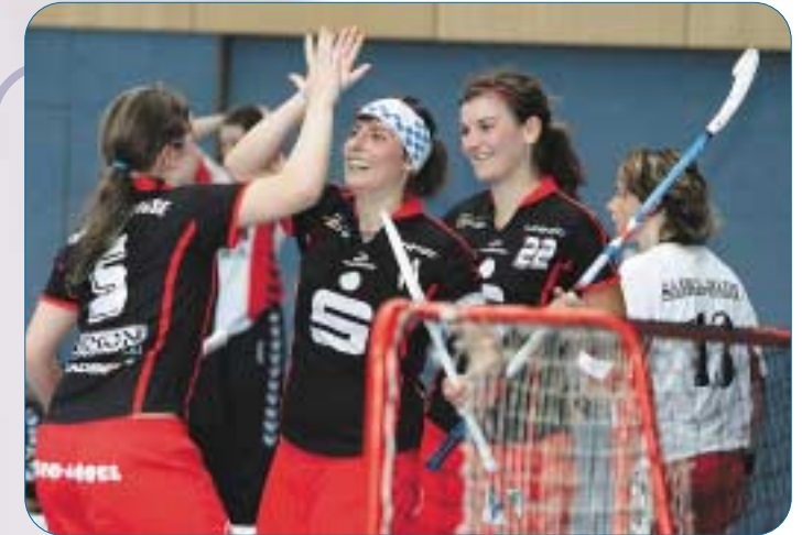
Seit Jahren zählt auch das UHC-Damenteam zu den Spitzenmannschaften in Deutschland

Floorball fasziniert, elektrisiert und zieht nahezu alle Mädchen und Jungen jeden Alters in seinen Bann. Spielerisch, freudvoll und mit Erfolgserlebnissen gepaart werden im Unterricht, Training und Wettkampf immer bessere Leistungen und Ergebnisse erzielt.